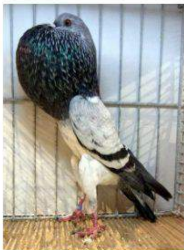
BL Grison Bleu 96 à Jules Devos cage 937