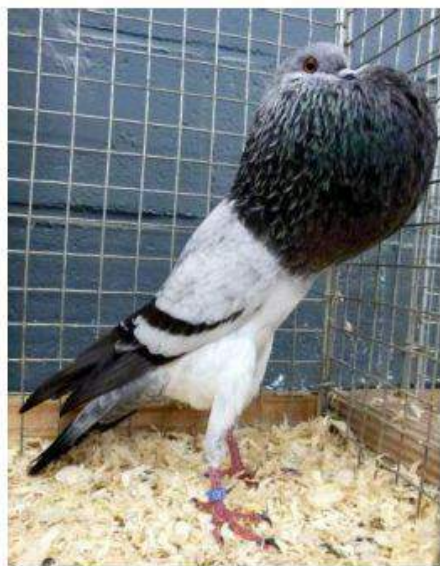
GPE EXC 97 & Champion Régional Grison Bleu à Jules Devos cage 395