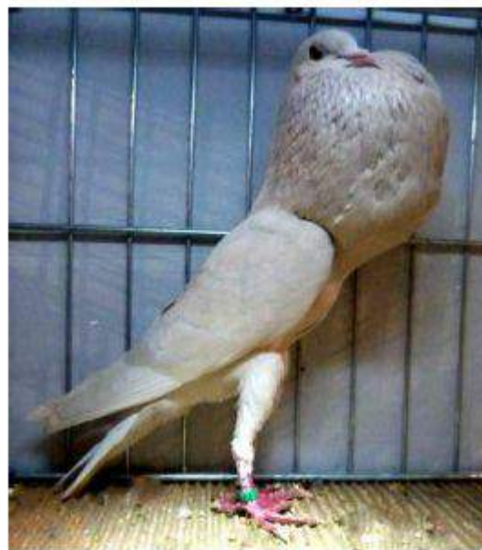
Champion 96 BL Isabelle Barré Blanc à Jules Devos Cage 947