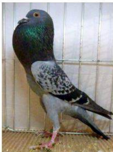
BL Bleu Ecaillé 96 à Jean Paul Chatelin & les enfants cage 933