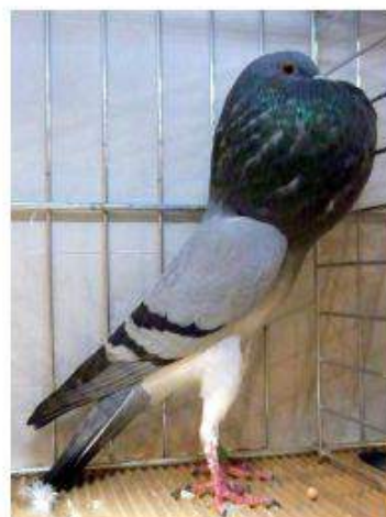
BL Bleu Barré Noir 95 à David Corroyette cage 932