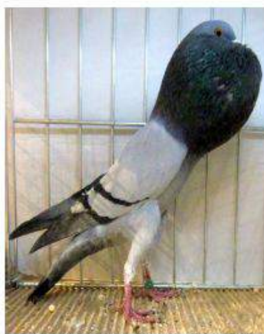
BL Bleu Barré Noir 95 à Philippe Lissy cage 930