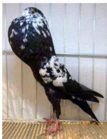
BL Tigré Noir 95 à Jules Devos cage 925