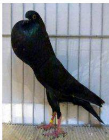
BL Noir 95 à Jean Paul Chatelin & les enfants cage 899