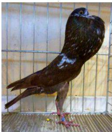
Champion BL 96 Tigré Rouge à Jules Devos Cage 912