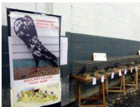
une partie de la salle