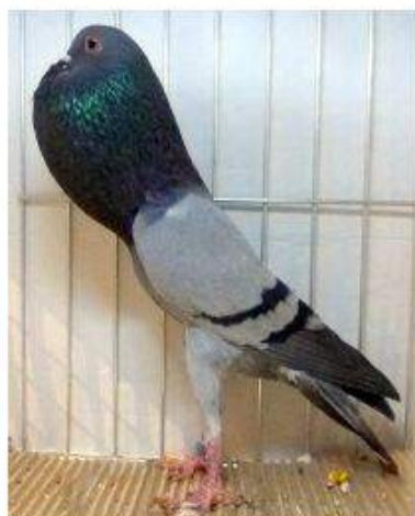
BL Bleu Barré Noir 96 à Jules Devos cage 929