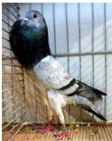
BL Grison Bleu 95 à Philippe Lissy cage 939