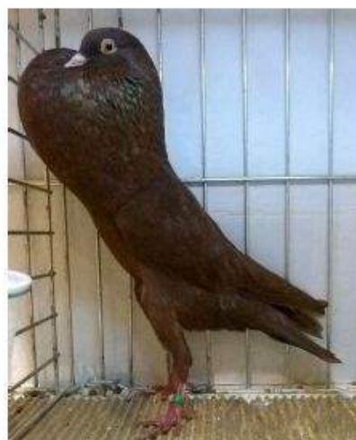
BL Rouge 96 à Jean Claude Hurel cage 917