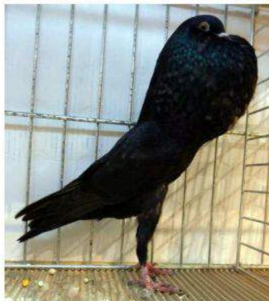
Champion 96 BL Noir à David Corroyette Cage 906