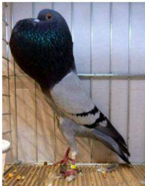
Champion 97 Exc BL Bleu Barré Noir à Jean Paul Chatelin et les enfants cage 926