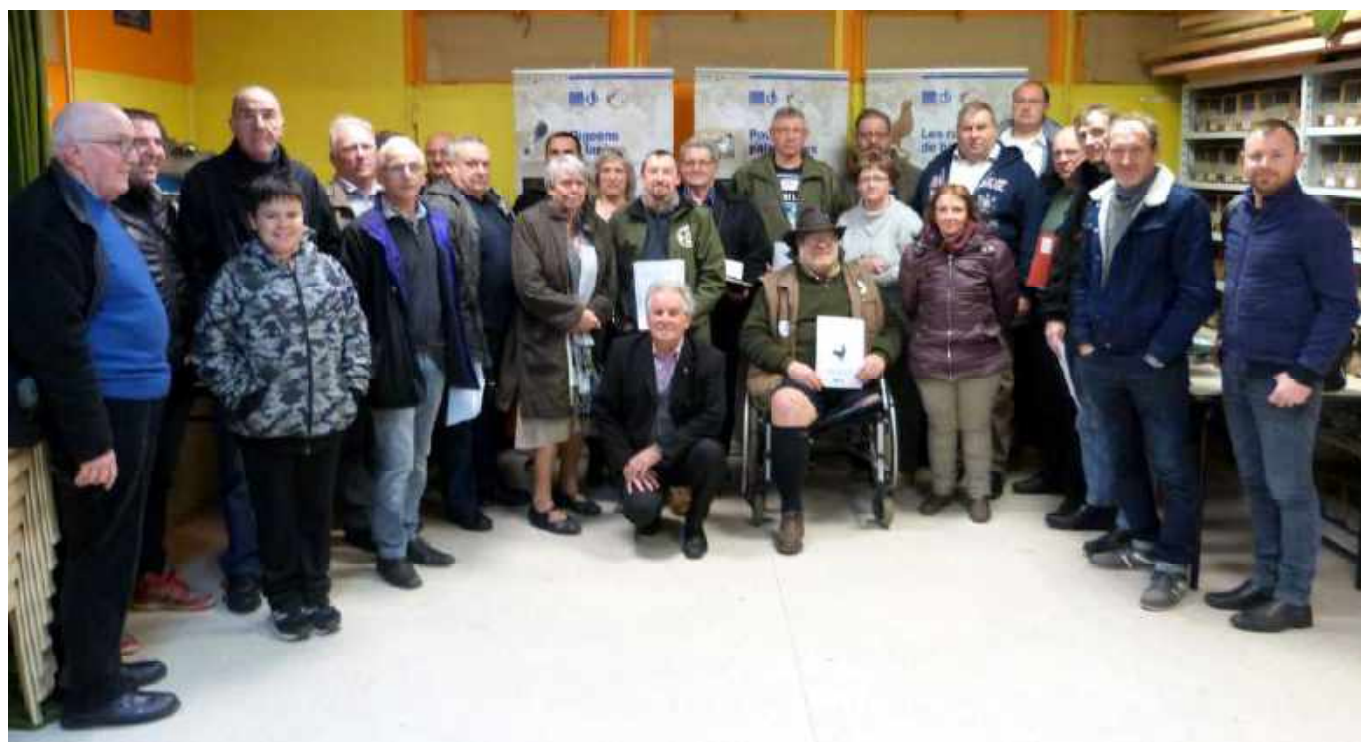
Assemblée Générale 2019