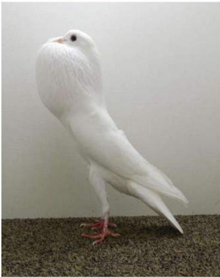
Champion unicolore 95 Devos J. c 2057