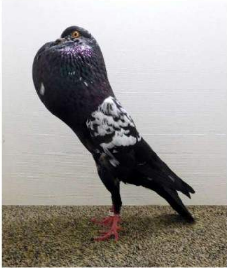
Champion tigré Exc 97 Devos J. c 2064