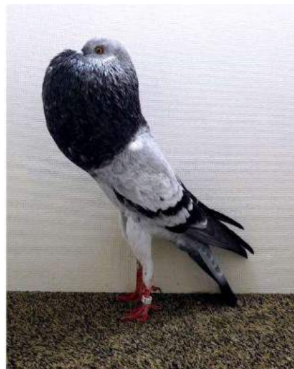
**** Champion Grison Exc 97 Chable L. c 2126

Le tigré bleu n'est pas celui de Rennes (photo non exploitable ) Mais autre pigeon de Daries F.