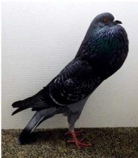
Champion écaillé 96 Lissy P. c 2099