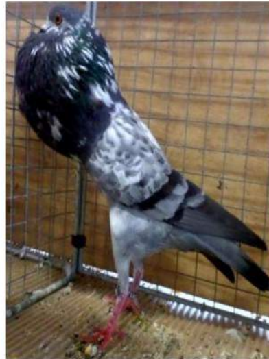
**** Champion tigré bleu 96 Daries F. c 2091