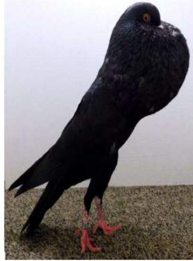
**** Champion unicolore Exc 97 Daries F. c 2062